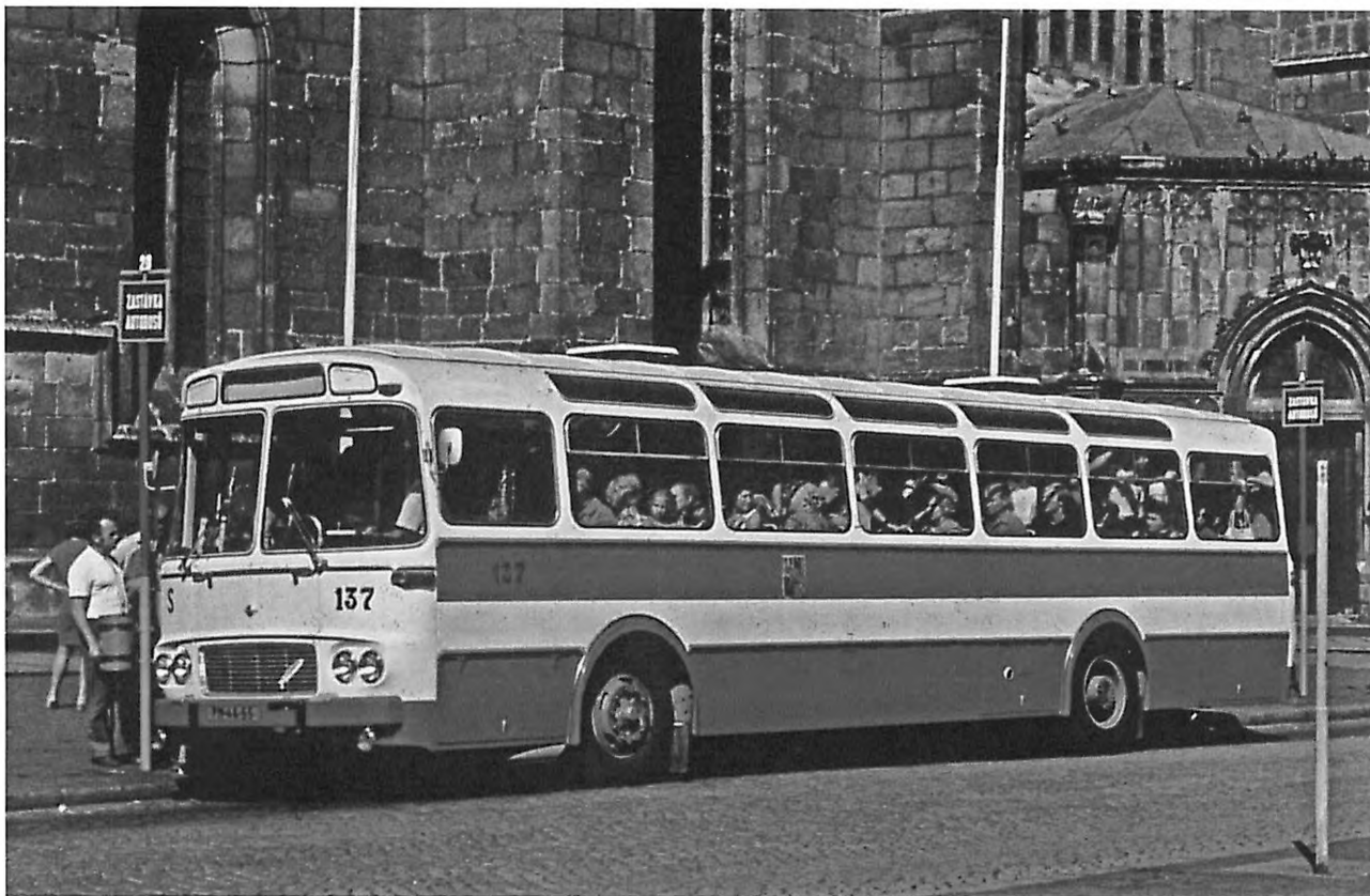
Autobus ze stejné série jako je autobus určený k renovaci, po zařazení do provozu. Autor Jiří Maurenz, nešířit dále.