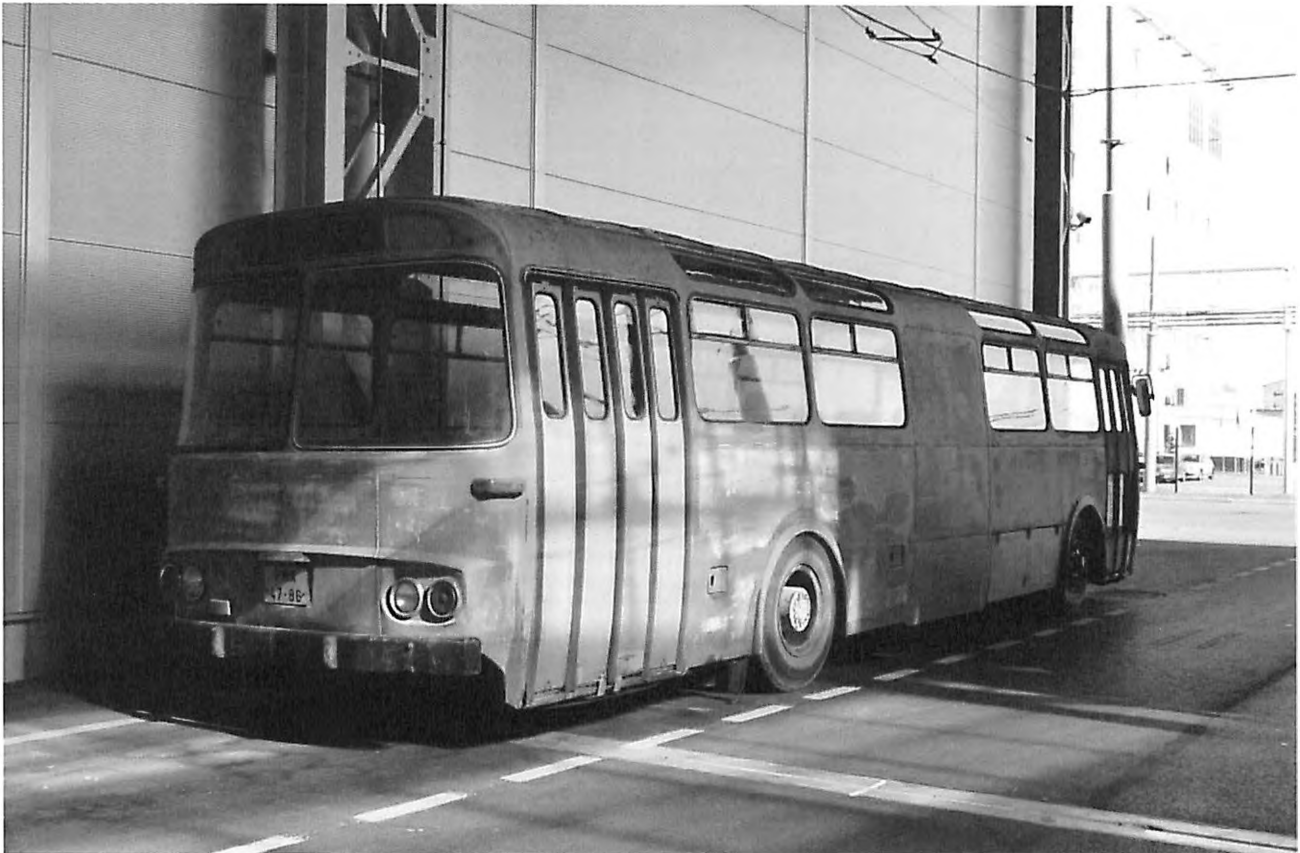
Současný stav autobusu k renovaci.